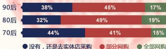
今年选择网购年货吗

每年年底，置办年货便成为了老百姓们的主打日程。随着消费购买方式习惯的变化，网购已逐渐成为人们置办年货的新渠道。网购年货品类齐全，对于忙于工作的人们，足不出户便可扫购完毕，省时方便；有些货品甚至比实体店还便宜两三成，较为划算；作为互联网主力军80,90后，是网购年货的重要消费者。在电商还未普及前，一家人热热闹闹去各大超市、商场采购年货，是一项全民活动。对于以前充满仪式感的年货大扫拼，70后的印象会更深厚，当中仍有44%的人选择去实体店采购所有年货。