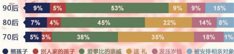
过年最烦遇到什么场面

● 熊孩子 ● 别人家的孩子 ● 爱攀比的亲戚 ● 送礼 ● 发压岁钱 ● 被安排相亲对象