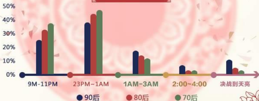
春节期间入睡时间段

风风火火的春节，70后表示压力好大，还让不让宝宝好好睡觉了？80后为了向全世界证明我们还年轻，坚决要熬过凌晨，然后静静地调好闹钟，11点59分起来发朋友圈。90后得意地笑，俗话说：“一日之计在于晨”，我们要决战到天明！